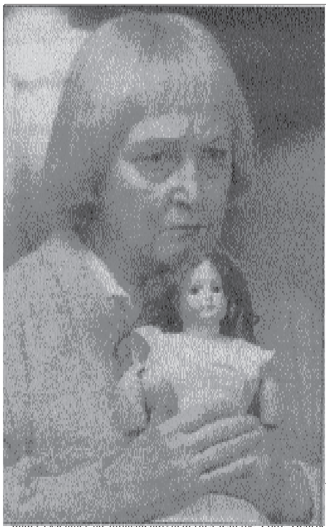
Under eksempel på biomstændighedernes æstetik.

Camp betoner måden, hvorpå noget fremtræder, fremfor hvad det handler om. Camp sætter parentes om den traditionelle opdeling i finkultur og massekultur, god og dårlig smag – ikke nødvendigvis for at gøre dårlig smag til god, men for at